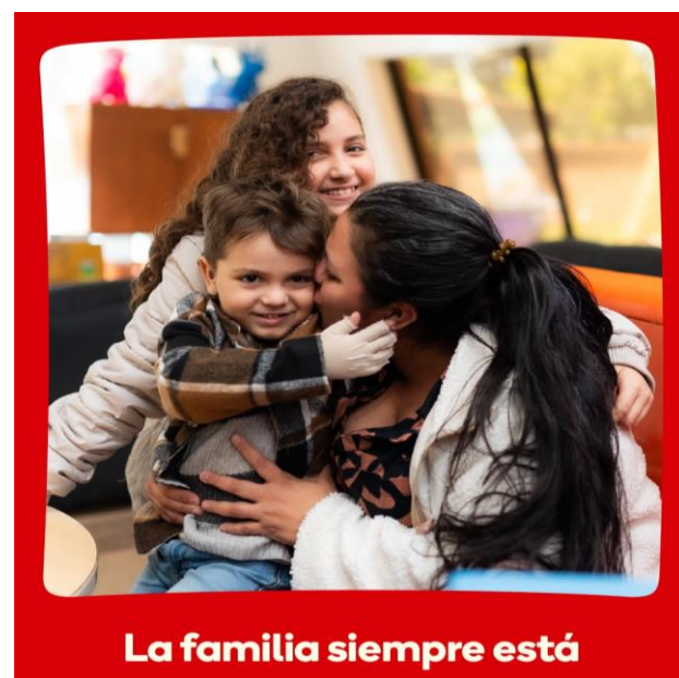
La familia siempre está

Con esta nueva identidad, Casa Ronald McDonald Guatemala reafirma su compromiso hacia el futuro: cuando un niño está enfermo, la familia no es opcional, es parte esencial del cuidado.