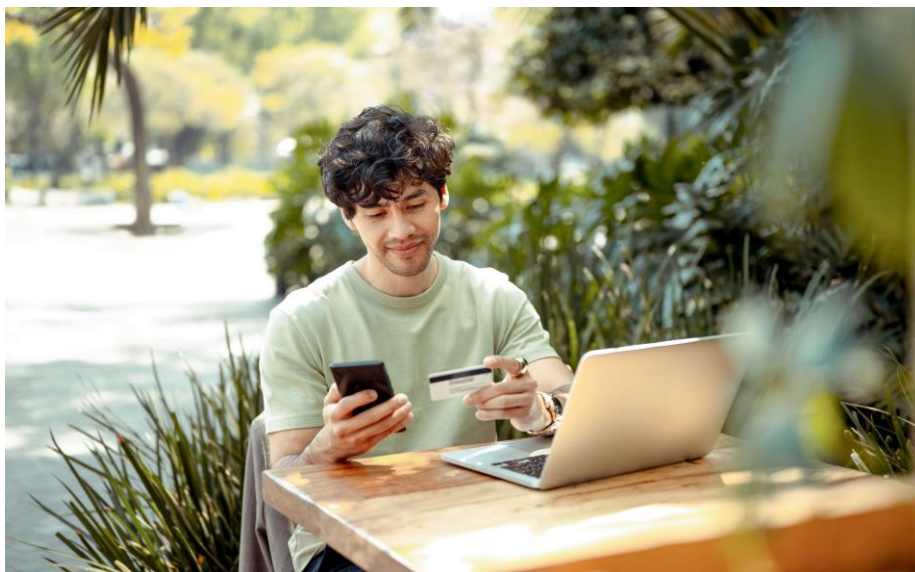
La amenaza evoluciona. Nosotros también.

Visa trabajó con la plataforma de pagos y su socio bancario para implementar un plan formal de remediación, que incluyó la suspensión de comercios de alto riesgo, la introducción de verificación de identidad obligatoria para todas las transacciones con tarjeta, el fortalecimiento del monitoreo de fraude en tiempo real en toda la plataforma, la reducción de los límites de transacción y la implementación de análisis forense diario para detectar cualquier actividad que pudiera pasar desapercibida. El resultado: una importante red de estafas desmantelada, millones en fraude potencial evitado y miles de viajeros protegidos.