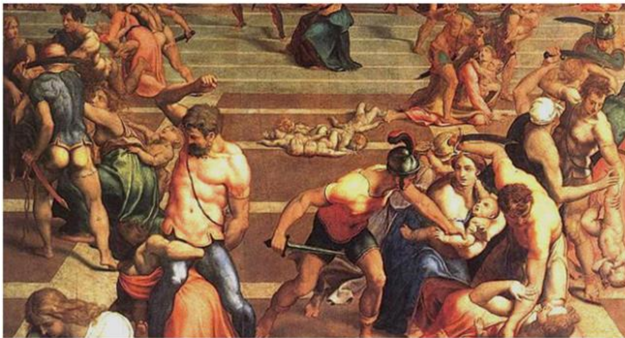
La masacre de los Santos Inocente de Daniele da Volterra

Otra versión las relaciona con el engaño de los Reyes Magos, que no revelaron a Herodes el paradero de Jesús. Además, aunque la Iglesia católica recuerda este episodio el 28 de diciembre, según el Evangelio de Mateo la matanza ocurrió después de la visita de los Magos, es decir, luego del 6 de enero