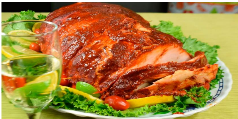
Pierna de cerdo

La pierna de cerdo es el platillo estrella para la cena de Fin de Año en Guatemala, preparándose horneada con una marinada de especias, cítricos (naranja), achiote, chiles (ancho), ajo, mostaza, vino tinto y hierbas (laurel, tomillo), rellenándola a veces con aceitunas, alcaparras y ciruelas para darle un sabor profundo y una textura jugosa, cocinada lentamente y barnizada para que quede dorada y deliciosa.