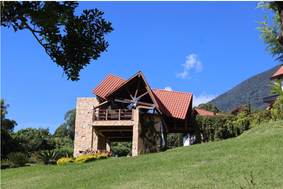
administración del inmueble”.

La Fiscalía de Extinción de Dominio del Ministerio Público (MP), informó que “en el interior del inmueble, el cual consta de cuatro fincas contiguas y una extensión territorial de aproximadamente 100 manzanas, se construyó una lujosa mansión cuyo valor se estima podría alcanzar los 5 millones de dólares de los Estados Unidos de América. Este extremo será confirmado por los avalúos que se realizarán al inmueble” .