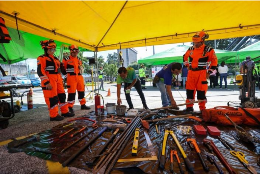
Simulacro Municipal. Estas prácticas permiten afinar los protocolos y potenciar las capacidades locales en la gestión del riesgo.

Continúan los simulacros en la ciudad de Guatemala, ante emergencias naturales