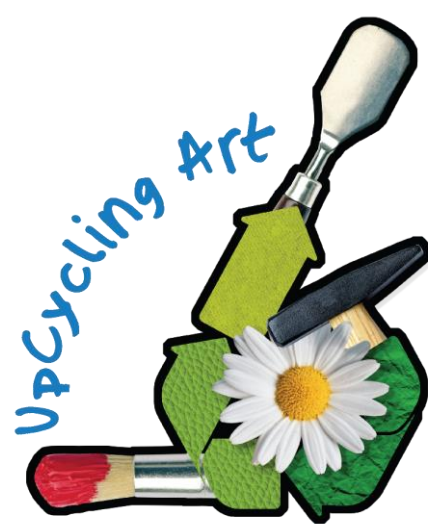
III Festival Rotario - Guatemala 2025

“Como artistas, nos encanta este festival pues nos saca de nuestra zona de confort y nos invita a repensar nuestros materiales que empleamos”, expresó una maestra de arte participante.