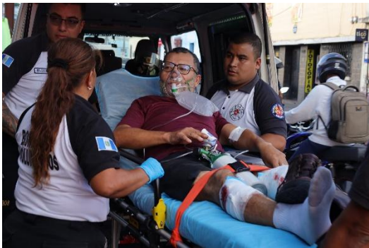
Los Bomberos Voluntarios trasladaron a los pilotos de Tuc Tuc:

De forma preliminar se conoció que el ataque armado fue contra pilotos de Tuc Tuc, pues en las cercanías de la Martí, hay una ubicación donde se transborda a los mismos.