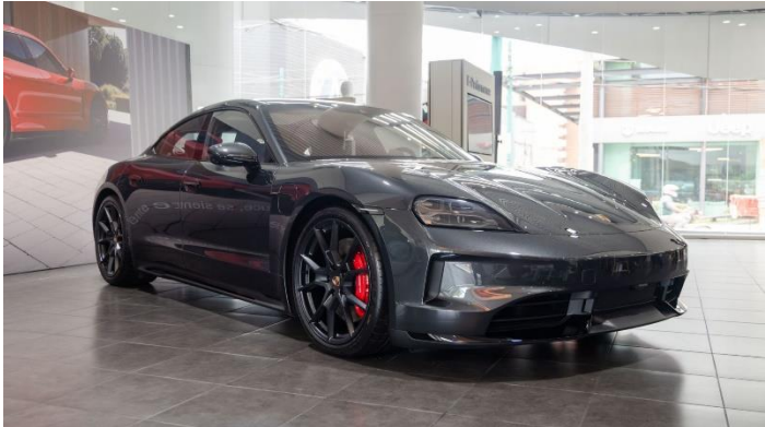
Porsche Guatemala y Grupo Los Tres, distribuidor exclusivo de Porsche en Guatemala, anunciaron la llegada oficial al país de una nueva versión del deportivo eléctrico