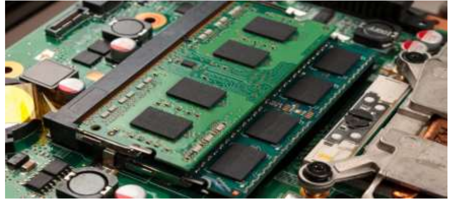
Lista de aplicaciones que más consumen memoria caché

La memoria caché es un tipo de memoria rápida que se utiliza para almacenar datos que el procesador ha utilizado recientemente. La memoria caché ayuda a mejorar el rendimiento del dispositivo al evitar que el procesador tenga que acceder a la memoria principal, que es más lenta.