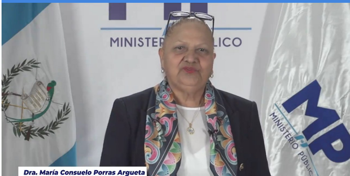
Dra. María Consuelo Porras Argueta