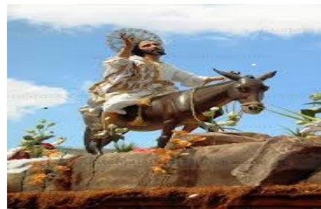
Recorrido de Jesús de las Palmas 2023, procesión Domingo de Ramos