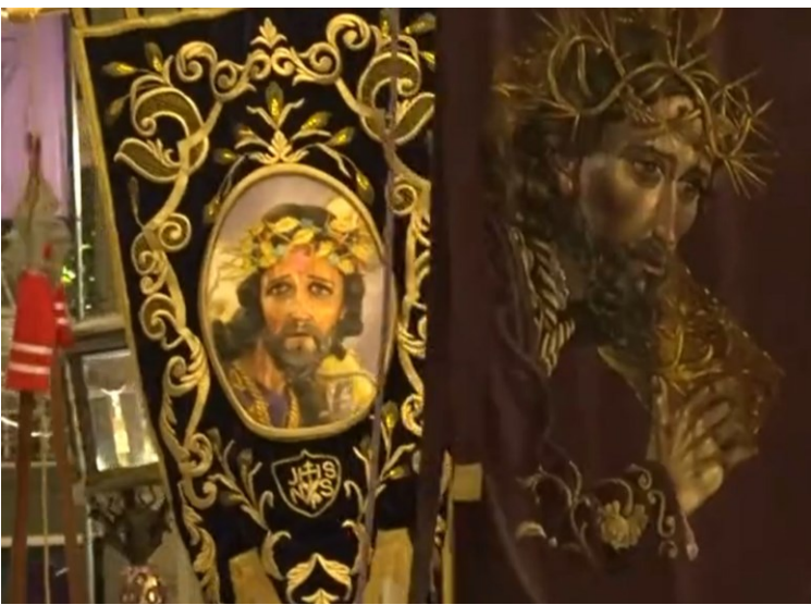
Entrada de Jesús del Consuelo a la Iglesia de la Recolectión en la ciudad de Guatemala.