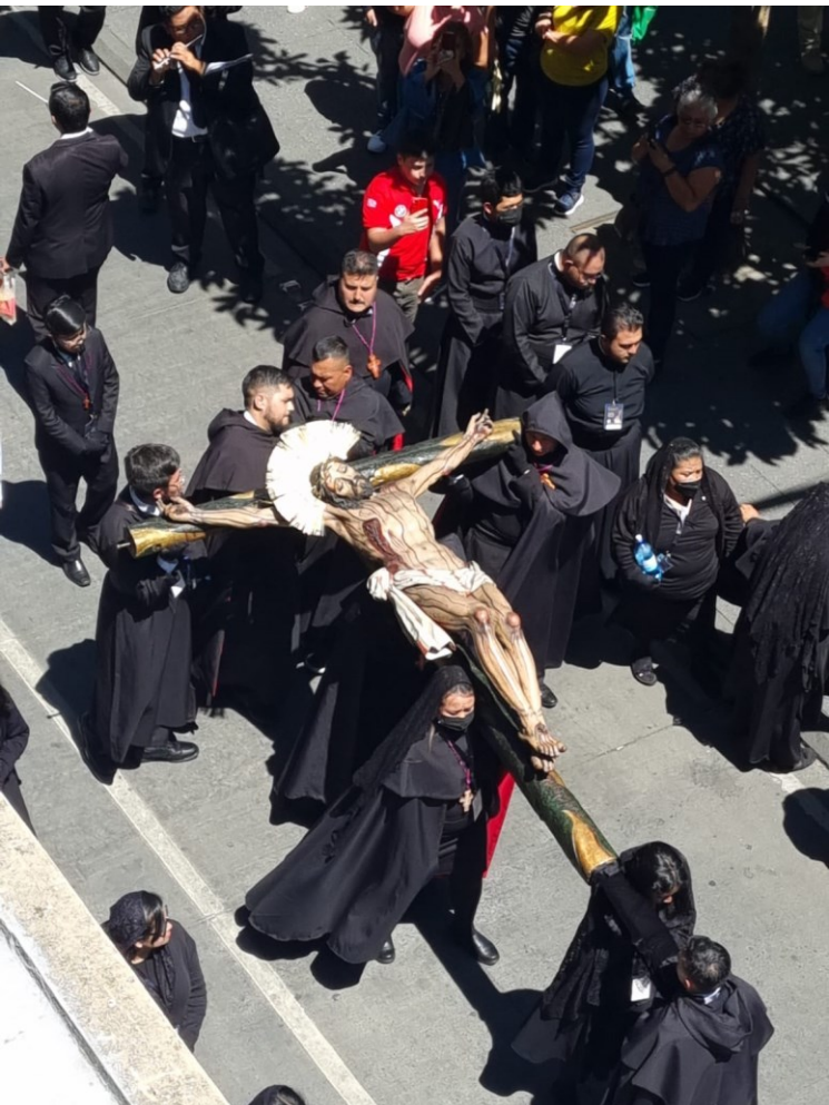
Retorno de imágenes de devoción a sus templos, tras acto protocolario en la Plaza de la Constitución, en la ciudad de Guatemala.