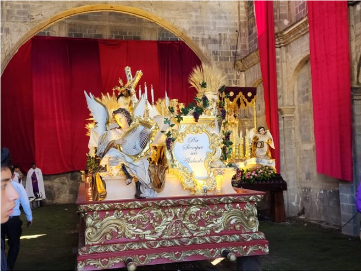
Salida del Cortejo Procesional de Jesús Nazareno de la Salvación del Templo Santa Catalina Bobadilla, en Antigua Guatemala.